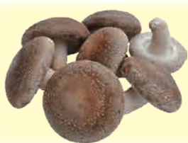
肉厚したけ 肉厚、ジューシー、食べごたえ抜群。