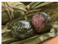
笹だんご(つぶあん入) (5個袋入) 1,080円(税込)