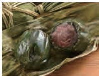
笹だんご(こしあん入) (5個袋入) 1,080円(税込)