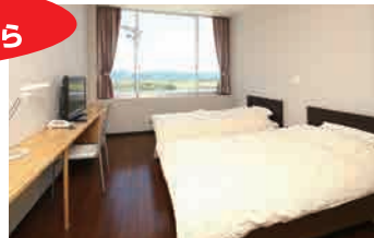
和室、洋室の2タイプがあります。

お食事処では麺類・どんぶり・定食・お飲み物・つまみ類をご用意。お食事だけのお客様も大歓迎です。のんびりお風呂につかった後、もっとゆっくりしたいという方には併設されたホテルをご利用頂けます。