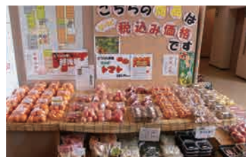
旬の果物や野菜が揃っています。