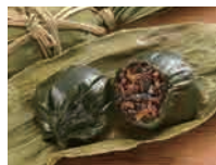
笹だんご(あらめ入) (5個袋入) 1,350円(税込)