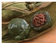
笹だんご(きんぴら入) (5個袋入) 1,350円(税込)