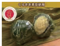
茶豆笹だんご(くろさき茶豆) (5個袋入) 1,350円(税込)