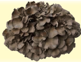
濃厚しめじ 濃厚な味と香り。