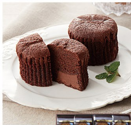
注文 No. 058 〈ミカド珈琲〉トリュフショコラケーキ