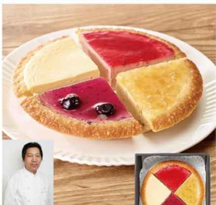
注文 No. 057 〈ガト-SHIRAHAMA〉チーズケーキ アソート