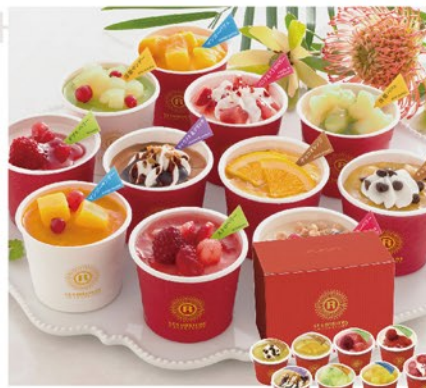
注文 No. 055 銀座京橋 レ ロジェ エギュスキロール アイス