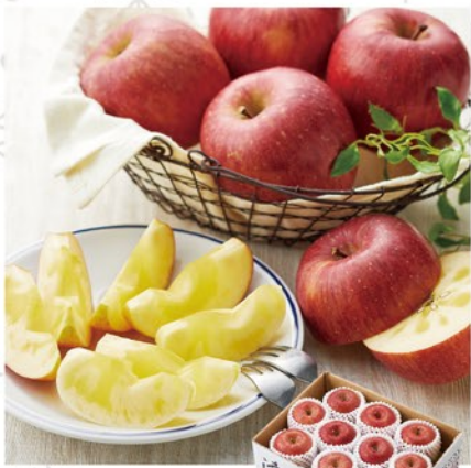
注文 No. 051 青森 蜜入りりんご 蜜秀