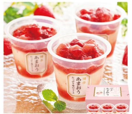
注文 No. 056 博多あまおう たっぷり苺のアイス