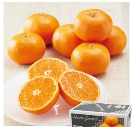
注文 No. 053 〈早和果樹園〉有田みかんA

T-3k ※申込締切:12月10日@ 本体価格3,703円 (税込価格3,999円)