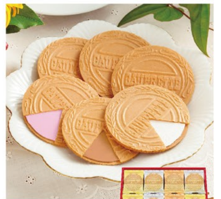
注文 No. 059 〈東京風月堂〉ゴーフレット48枚入