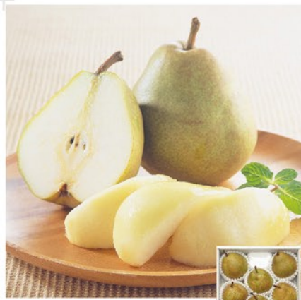
注文 No. 052 山形産 ラ・フランス