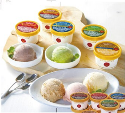
注文 No. 054 〈共進牧場〉ジャージーミルクアイスクリーム