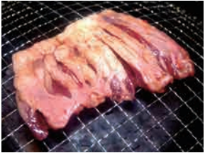
◆花咲カルビステーキ ……………(税込) 880円