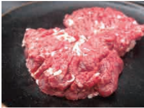
◆花咲熟成モモステーキ ……………(税込) 880円