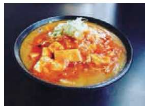
◆美國豚汁ラーメン2辛 ……………(税込) 850円