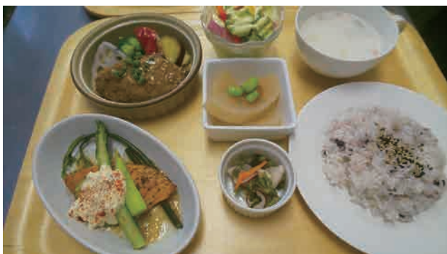
エボリエ気まぐれランチプレート ¥1,050 (税込)