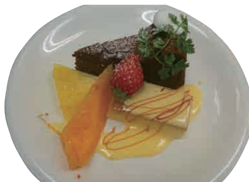
ランチデザート ¥250 (税込)