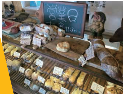
100%オーガニックパンの数々