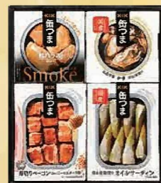
注文 No. 089 缶つまプレミアム KT-200 本体価格 1,650円 (税込価格 1,782円)