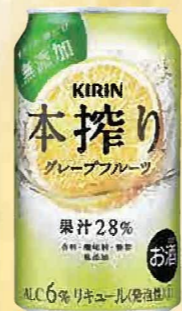
注文 No. 087 キリン本搾り グレープフルーツ KNK-8 本体価格 2,700円 (税込価格 2,970円) ● (缶350ml×24)