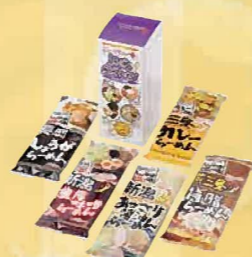
注文 No. 090 新潟5大ラーメン NR-V2 本体価格 1,200円 (税込価格 1,296円)