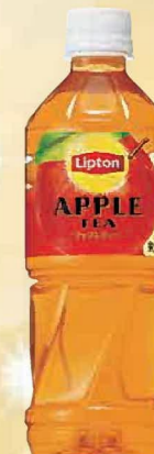
注文 No. 096 リプトン アップルティー KNK-14 本体価格 2,300円 (税込価格 2,484円) ● (500ml×24)