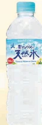
注文 No. 091 天然水 KNK-9 本体価格 2,100円 (税込価格 2,268円) ● (550ml×24)