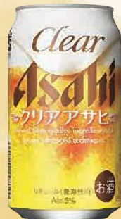
注文 No. 084 クリアアサヒ KNK-5 本体価格 2,800円 (税込価格 3,080円) ● (缶350ml×24)