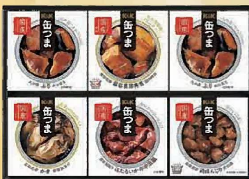
注文 No. 088 缶つまプレミアム KPM-300 本体価格 2,350円 (税込価格 2,538円)