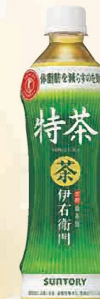
注文 No. 092 伊右衛門 特茶 KNK-10 本体価格 3,800円 (税込価格 4,104円) ● (500ml×24)