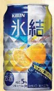
注文 No. 086 キリン氷結 レモン KNK-7 本体価格 2,700円 (税込価格 2,970円) ● (缶350ml×24)