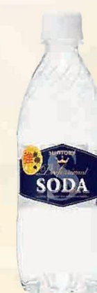
注文 No. 093 サントリーソーダ KNK-11 本体価格 2,450円 (税込価格 2,646円) ● (490ml×24)