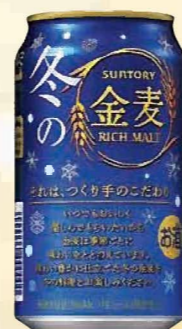
注文 No. 083 サントリー金麦(新) KNK-4 本体価格 2,800円 (税込価格 3,080円) ● (缶350ml×24)