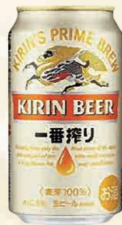
注文 No. 081 キリン一番搾り KNK-2 本体価格 4,600円 (税込価格 5,060円) ● (缶350ml×24)