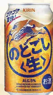
注文 No. 082 キリンのどごし(生) KNK-3 本体価格 2,800円 (税込価格 3,080円) ● (缶350ml×24)