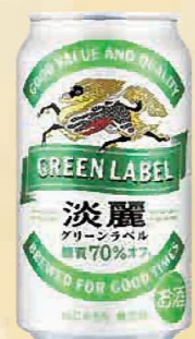
注文 No. 085 キリン 淡麗グリーンラベル KNK-6 本体価格 3,000円 (税込価格 3,300円) ● (缶350ml×24)