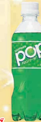
注文 No. 094 POPメロンソーダ KNK-12 本体価格 2,200円 (税込価格 2,376円) ● (430ml×24)