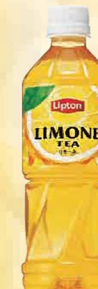
注文 No. 095 リプトン リモーネ KNK-13 本体価格 2,300円 (税込価格 2,484円) ● (500ml×24)