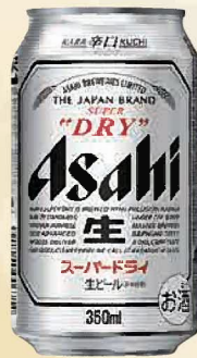
注文 No. 080 アサヒスーパードライ KNK-1 本体価格 4,600円 (税込価格 5,060円) ● (缶350ml×24)