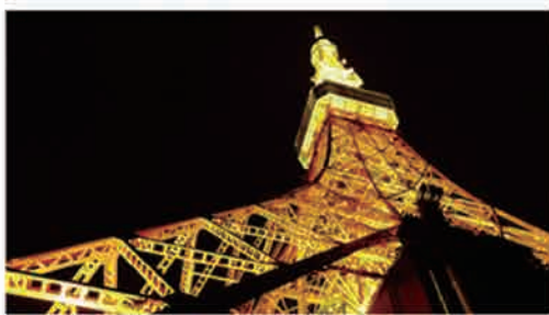
スマート アクティブコントラストあり