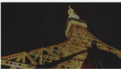
スマート アクティブコントラストなし