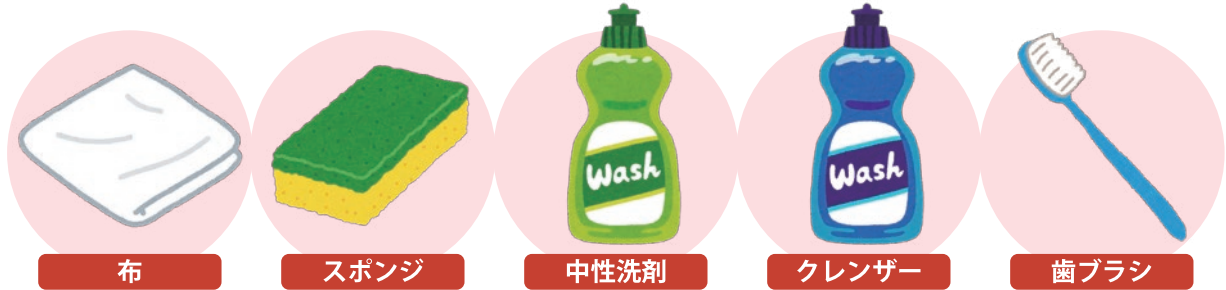
布 スポンジ 中性洗剤 クレンザー 歯ブラシ

ガスコンロの周辺はいろいろな汚れが付着しやすく、お手入れが大変です。普段からこまめにお手入れしておくのが、コンロを綺麗に保つポイントです。